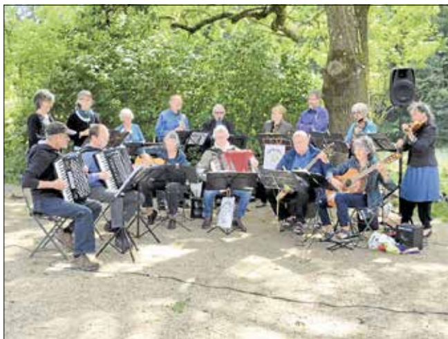
Birkeris er blandt de musikalske indsal på Barresøgård den kommende sæson.

les, der er på programmet. Bag navnet står tre femte-dele af det professionelle Repeatles. Bandet fejrer 50-året for udgivelsen af Abbey Road-albummet, men spiller også mange andre Beatles-sange.